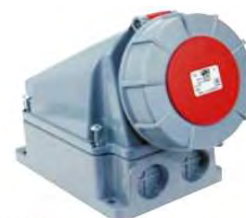
TSP63 y TSP125