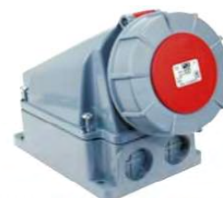
TSP63 y TSP125